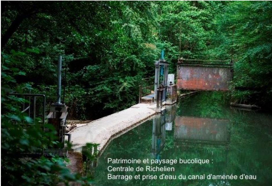
Patrimoine et paysage bucolique : Centrale de Richelien Barrage et prise d'eau du canal d'aménée d'eau

Mais tout se passe comme s'il fallait éradiquer toutes les petites centrales, sans soucis du passé et de notre patrimoine. Ce patrimoine est le grand absent dans la pesée d'intérêts, puisqu'il s'agit de cela. Rien sur la valeur patrimoniale d'une époque qui a fait notre cité depuis des siècles. Rien non plus sur la justification d'un démantèlement complet et non partiel qui pourrait satisfaire les enjeux en