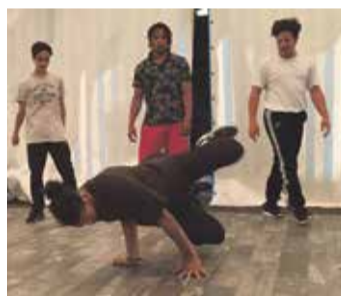
appréhender le monde.

Le but est surtout de découvrir des aspects inconnus du monde qui entoure les enfants afin de leur donner confiance. Naturellement, amasser des points est motivant. Les trois meilleures équipes ont été récompensées en fin de journée. Quatre même ! Les deuxièmes étaient ex aequo... Les organisateurs ont trouvé des prix locaux : mur de grimpe ou activités à Port-Choiseul, une manière d'encourager une curiosité pour des choses qui se passent tout près pour mieux