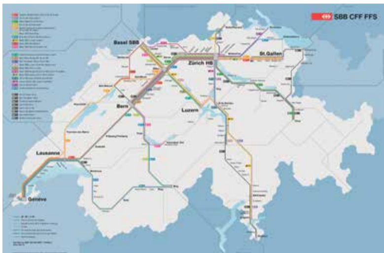
Illustration : SBB CFF FFS