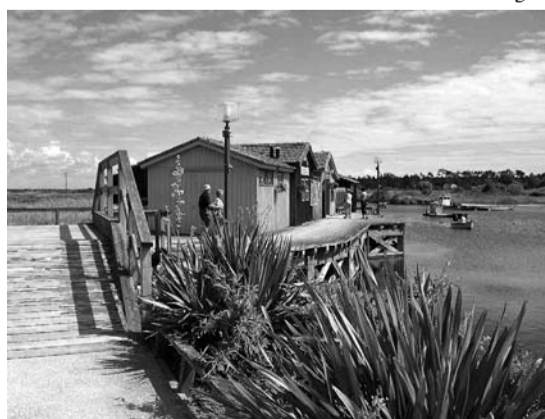
Ci-dessus : Ce que nous n'avons pas eu. 1 Définition du développement durable selon la Commission Brundtland (ONU) en 1987.