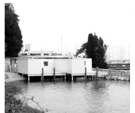
Ci-dessus : Ce que nous avons !

Plus d'informations seront mises en ligne sur le site de la Commune à l'adresse : www.versoix.ch